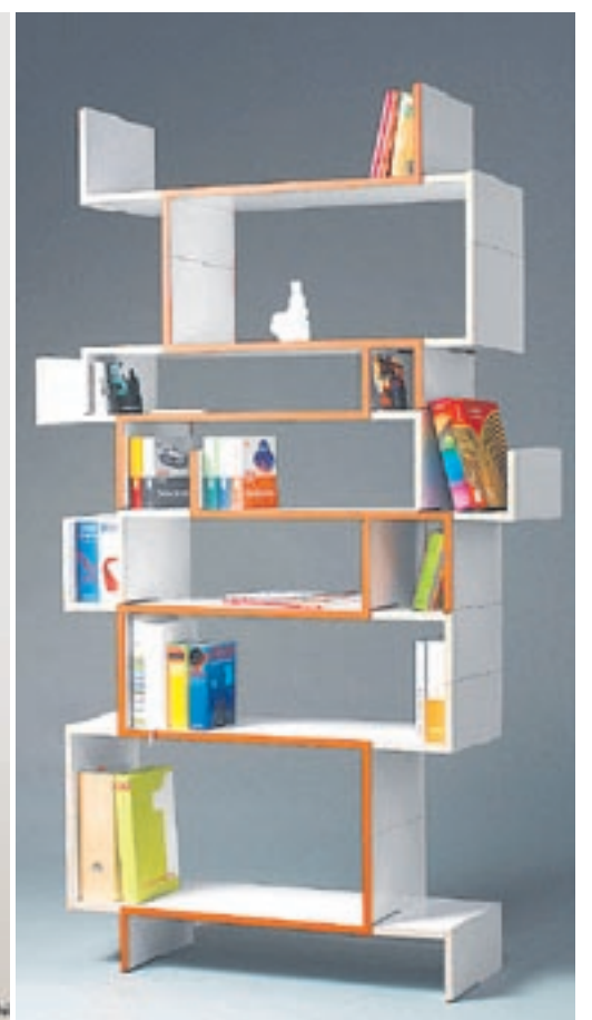
Der Kreativität sind auch bei der Gestaltung von Bücherregalen keine Grenzen gesetzt: (v. l. n. r.) «billy wilder 3», die Lesehöhle «Cave» und eine der vielen Varianten von «Oderso».